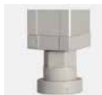
Pata regulable Adjustable leg