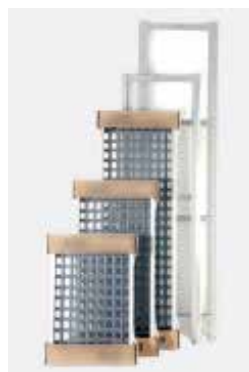
Detalle soporte ángulo Detail of Corner ass

NOTE: For other dimensions in length and/or depth, please inquire