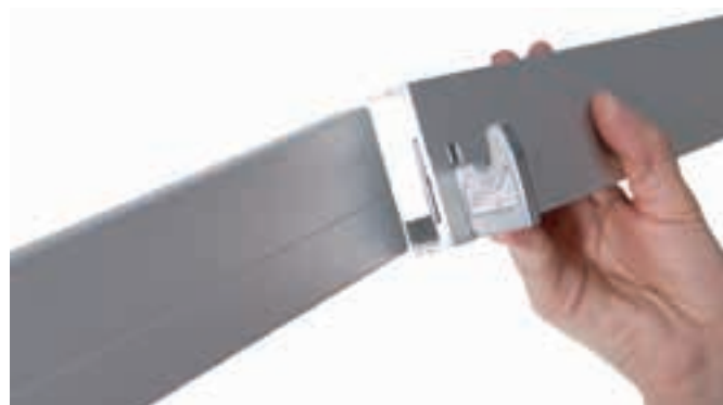
Detalle soporte ángulo Detail of Corner ass

They facilitate access to corners allowing a higher stocking capacity. It's price is calculated by DEDUCTING the price of a support rack from the chosen linear module, and ADDING the price of one corner assembly for each shelf