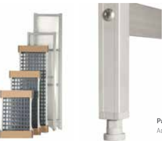
Pata regulable Adjustable leg

Para cualquier otra medida de fondo, largo o altura de estantería, rogamos consulten nuestro departamento técnico comercial. For other measures in shelves, consult with our Technical Department.