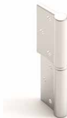
Charnière acier inoxydable de série